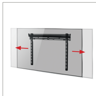
Ausrichtung des Bildschirms nach der Installation für eine stets perfekte Positionierung