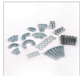
Alle Montageteile im Lieferumfang enthalten