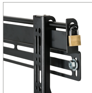
Sicherheitsschrauben, Inbusschlüssel und Verriegelungsstangen für eine sichere Montage im Lieferumfang enthalten